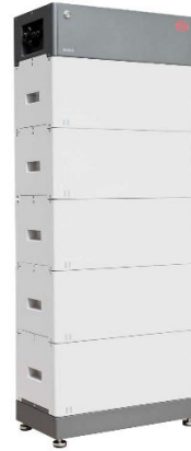
8 + 10 kW Wechselrichter + 12,8 kWh BYD HVS Speicher