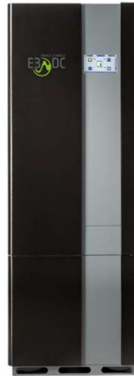
13,8 kW Wechselrichter + 14 kWh E3DC S10 X Compact 14.0 Speicher