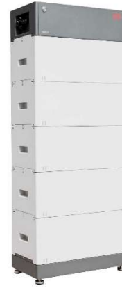
8 kW Wechselrichter + 5,1 kW BYD HVS Speicher