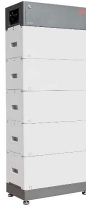
10 + 10 kW Wechselrichter + 12,8 kWh BYD HVS Speicher