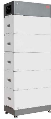
10 kW Wechselrichter + 10,2 kW BYD HVS Speicher